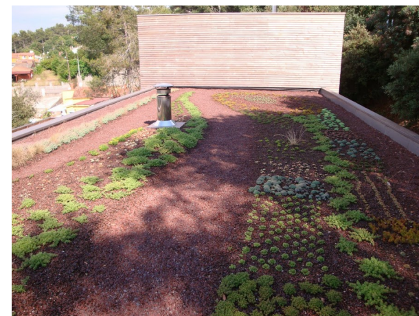
Le toit 6 mois plus tard