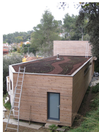
Vue sur le toit une fois les plantations terminées