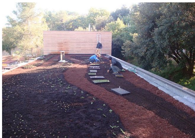
Plantation: de la délicatesse pour chaque plante !